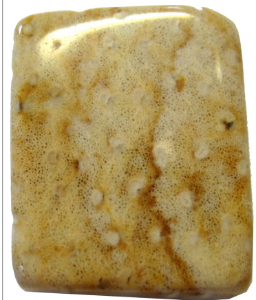
Maserung in versteinertem Palmholz [54]