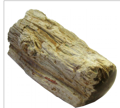
versteinertes Holz [53]