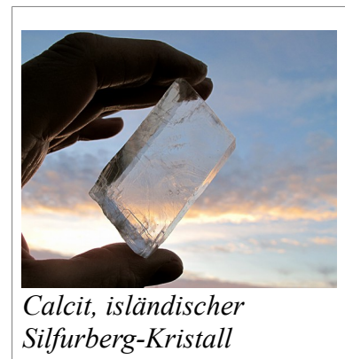
Calcit, isländischer Silfurberg-Kristall